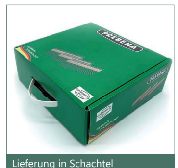
Lieferung in Schachtel