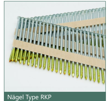
Nägel Type RKP