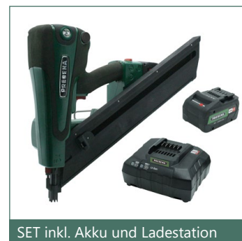
SET inkl. Akku und Ladestation